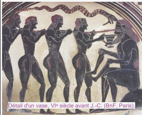
Détail d'un vase, VI e siècle avant J.-C. (BnF, Paris).

Doc. 3 Après la victoire grecque à Troie, Ulysse et ses compagnons retournent vers leur patrie, Ithaque, mais Poséidon dresse des obstacles sur leur route. Il les fait échouer sur l'île des cyclopes, géants avec un seul œil. Ils s'abritent dans la grotte du cyclope Polyphème. Mais celui-ci dévore plusieurs d'entre eux puis part en fermant la grotte. Ulysse raconte.